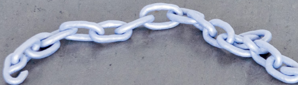
FRAGILE (LIFTING) CAPACITY (FRAGMENT) VARIABLE GRÖSSE KERAMIK, ACRYLFARBE, 2025