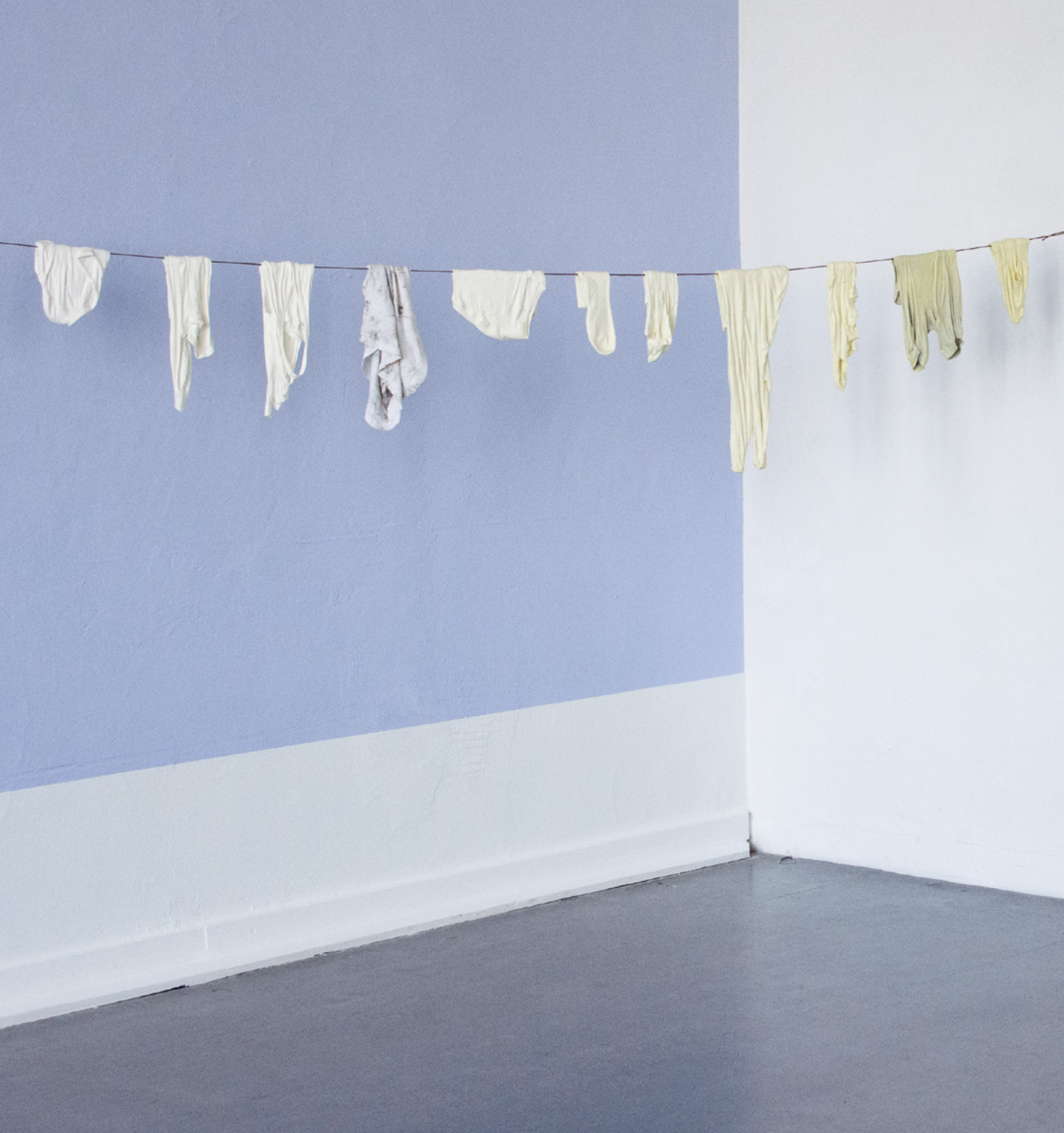
STILLE WÄSCHE IST TIEF 46 X 300 X 10 CM KERAMIK, TEXTIL, SPANNDRAHT 2021