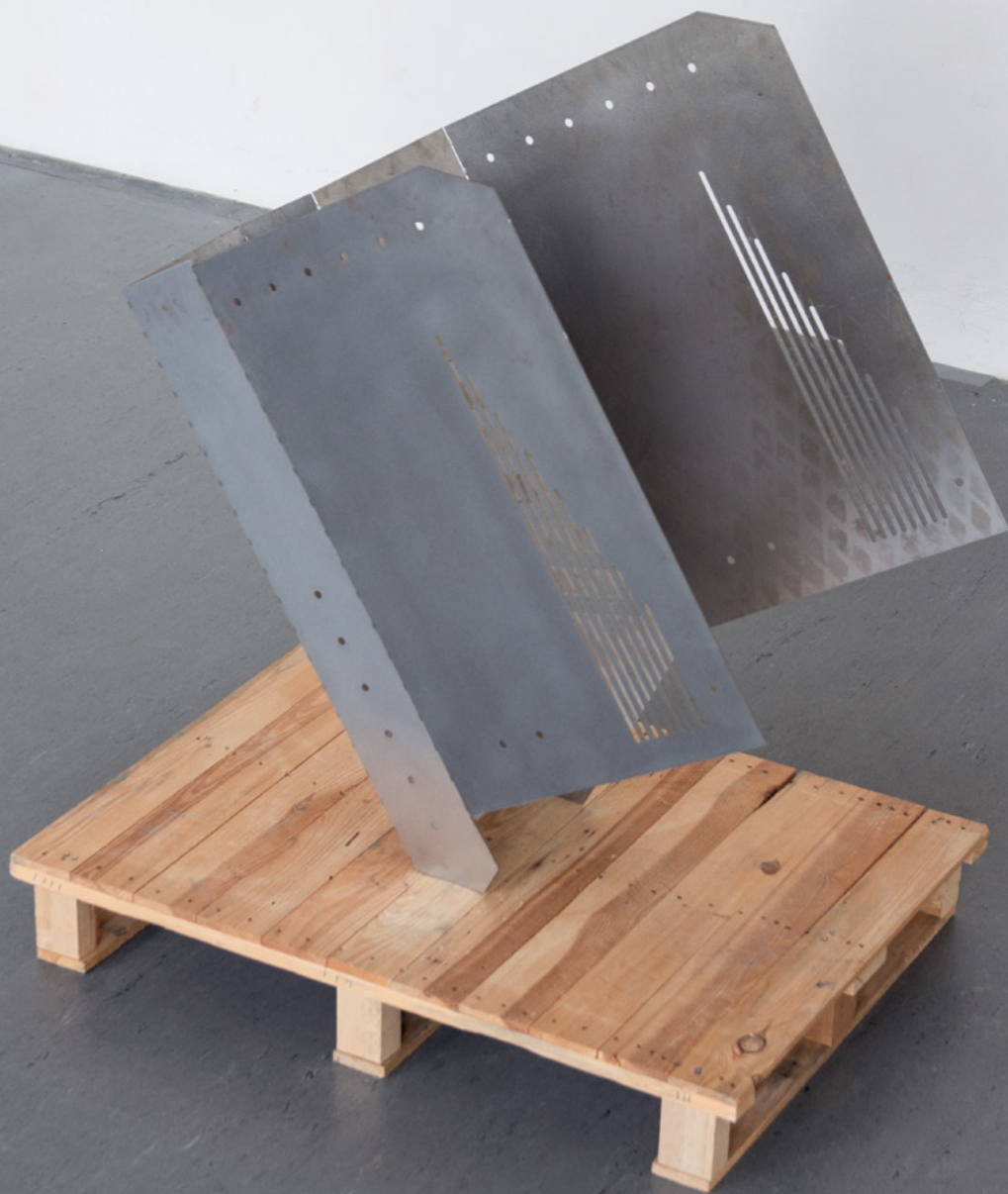
LOUNGER 110 X 65 X 100 CM STAHL, HOLZ, 2024