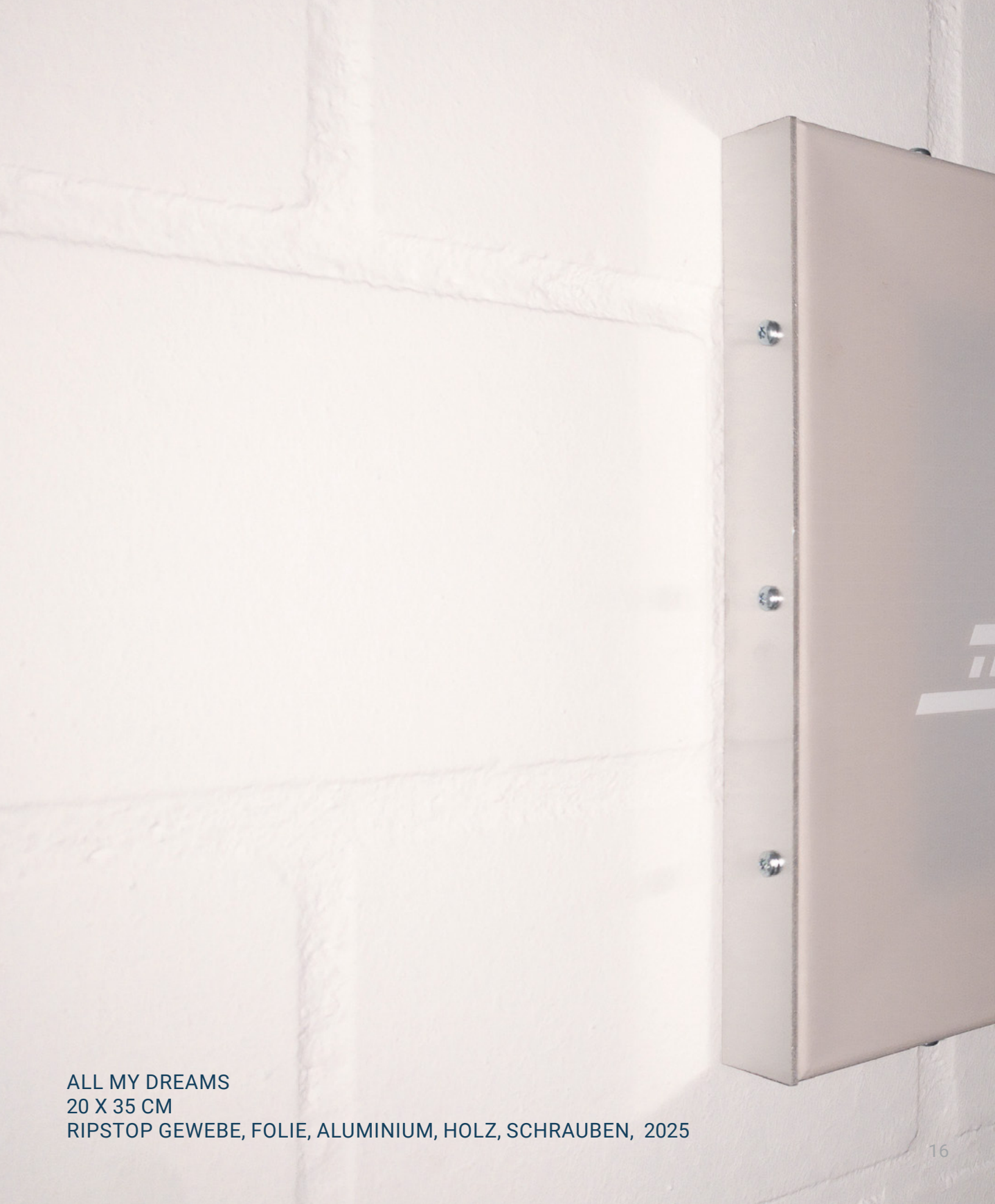
ALL MY DREAMS 20 X 35 CM RIPSTOP GEWEBE, FOLIE, ALUMINIUM, HOLZ, SCHRAUBEN, 2025